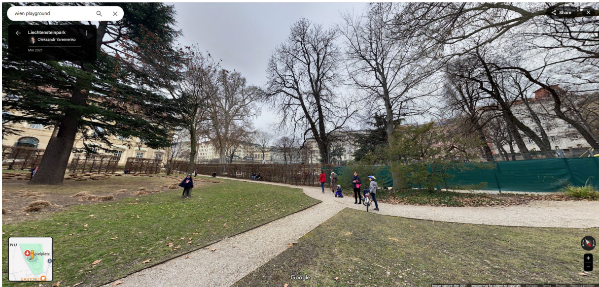
Bécs, Liechtenstein-palota kertje, bekerített játszótér