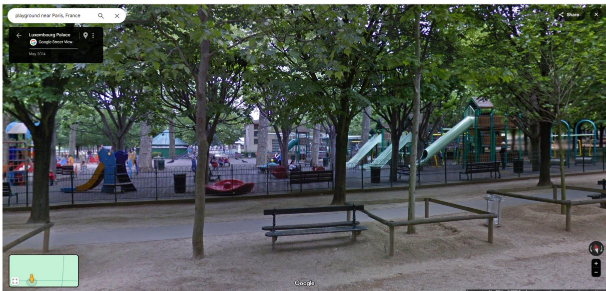
Párizs, a Luxembourg-kert bekerített játszótére