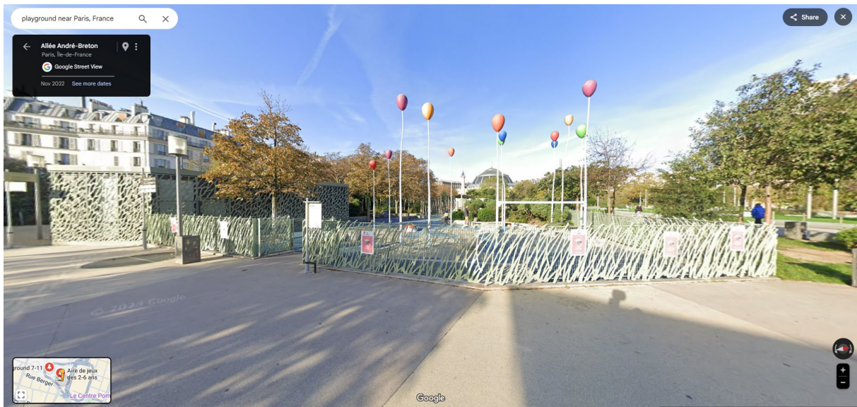
Párizs, bekerített játszótér

Általános tapasztalat, hogy külföldön a játszótérek be vannak kerítve. Az általunk vizsgált helyszínek mindegyikét bekerítették, abban az esetben is, ha a játszótér egy történeti park külön egységét alkotja, vagyis nem közlekedési utak határolják a játszótér.