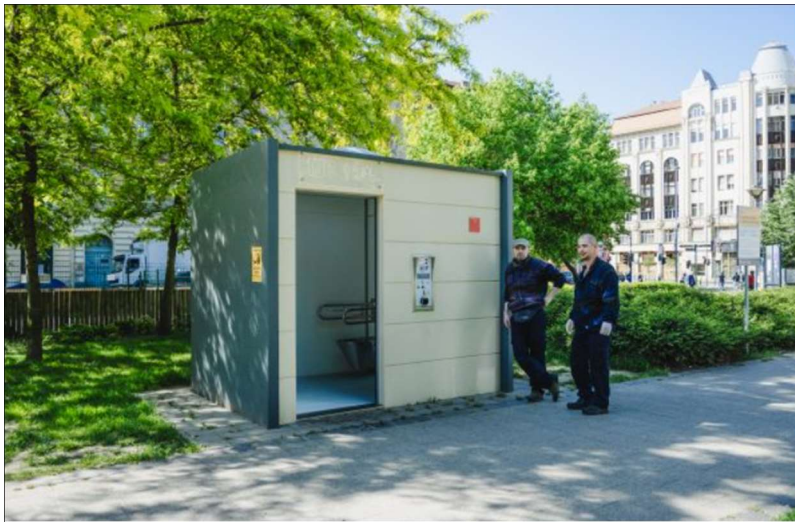
13. ábra: Automata közvéccé a II. János Pál pápa téren

a B–K Kft. terméke, amit gyártó több, mint 20 éve forgalmaz, az innovációért 2008-ban Magyar Termék Nagydíjjal jutalmazták és megkapta a sérültek.hu magazin különdíját és az Odafigyelés díját is.