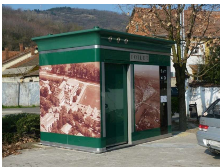
17. ábra: B-K Kft illemhelyének egyedi dekorációs lehetősége, akár bevételt jelentő reklámhordozó felület is lehet