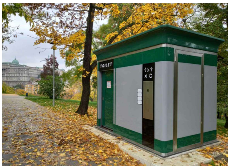
16. ábra: WC-Guide rendszerrel felszerelt okos WC a Tabánban (forrás: bandkaruhaz.hu.)