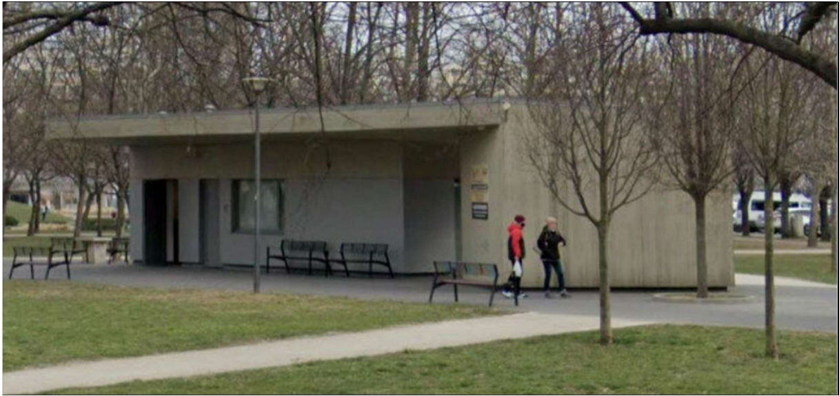
11. ábra: Nyilvános illemhely a Bikás parkban

építészeti környezetébe vagy a park berendezési tárgyival harmonizáló képi világába.