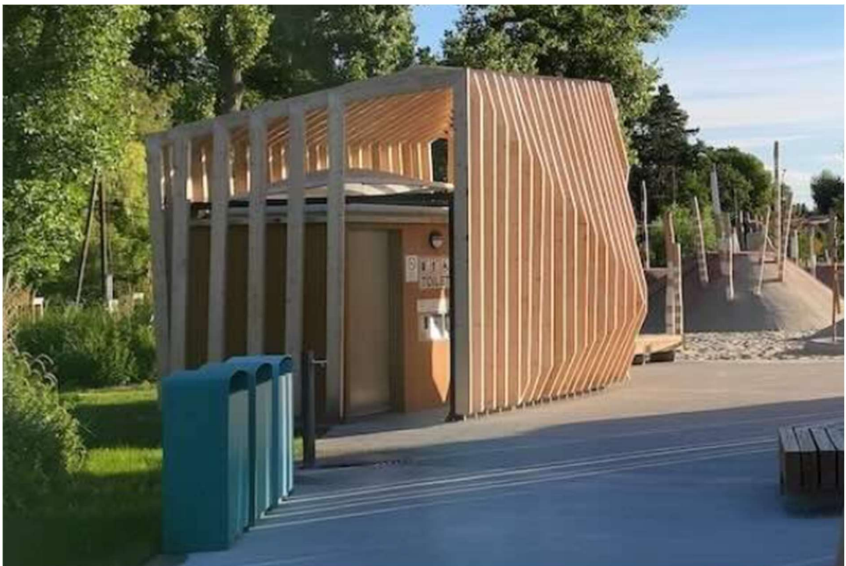
12. ábra: Köztes megoldás, automata illemhely fából készült installációval takarva a Pünkösdfürdő parkban

Az elmúlt években a fővárosban telepített automata vécék több termék családból, több külföldi és hazai gyártótól kerültek a közterekre. Ha a minőségi paraméterek azonosak, akkor mindig célszerű a hazait választani, könnyebb a garanciális szervizelés és az alkatrész beszerzés. A fővárosi nyilvános illemhelyek közül több is