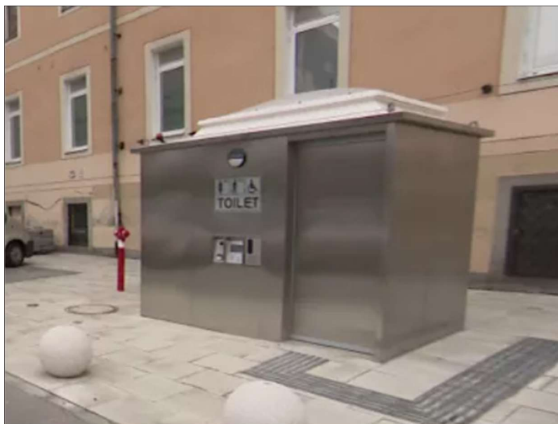
14. ábra: Automata közvéccé a Blaha Lujza téren