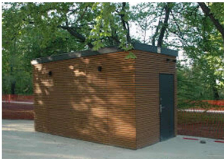
15. ábra: Ingyenesen használható illemhely a Normafa Parkban