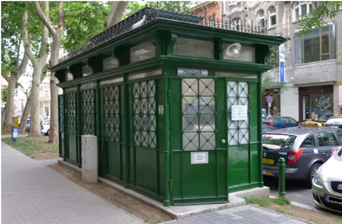
2. ábra: A felújított „zöldvillamos” a Nagymező utcában

Ugyanekkor, 1895-ben kezdték el építeni a „zöldházakat” vagy pestiesen „zöldvillamosnak” nevezett közvéceket, melyekből egy pár még mindig áll a belvárosban. A Beetz-féle „Olajjal szagtalanított vizelde” világszabadalom volt. A két háború között, mikor a főváros lakóinak száma 800 ezer és 1 millió között volt, 82 illemhely működött a közszolgálatára a fővárosban, belőlük 12 megsemmisült a háború alatt. Az elmúlt évtizedekben számuk igencsak lecsökkent, de maradt még mutatóban a Szent János kórház mellett, a Nagymező utcában és a Lövölde téren, a Ferenc téren, a Lovas úton és a Rózsák terén. A műemléki jellegű építményeket 1985-ben kezdték felújítani, az eredeti külsőt a vandalizmussal szembeni ellenálló védelemmel látták el, belül pedig korszerűsítették őket.