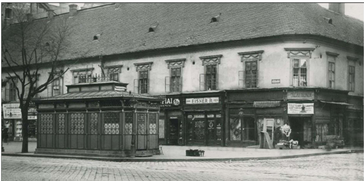
1. ábra: A „zöldvillamos” a Rákóczi út és a Vas utca sarkán 1911-ben

A nagykorút több szakaszban 20 év alatt épült ki, a teljes körút megnyitására a millenniumi ünnepek keretében 1896. augusztus 31-én került sor. A körút fontos szolgáltatásai közé tartoztak az útmentén elhelyezett öntöttvas vizeldék, melyeket a Közmunkatanács Párizsból vásárolt. Az ünnepekre várt tömegek kiszolgálására a Deák téri és körüti illemhelyek száma kevés volt, ezért a városvezetés a házmestereket utasította, hogy a házak közös illemhelyeinek kulcsát bárki szükségben lévő számára adják át.